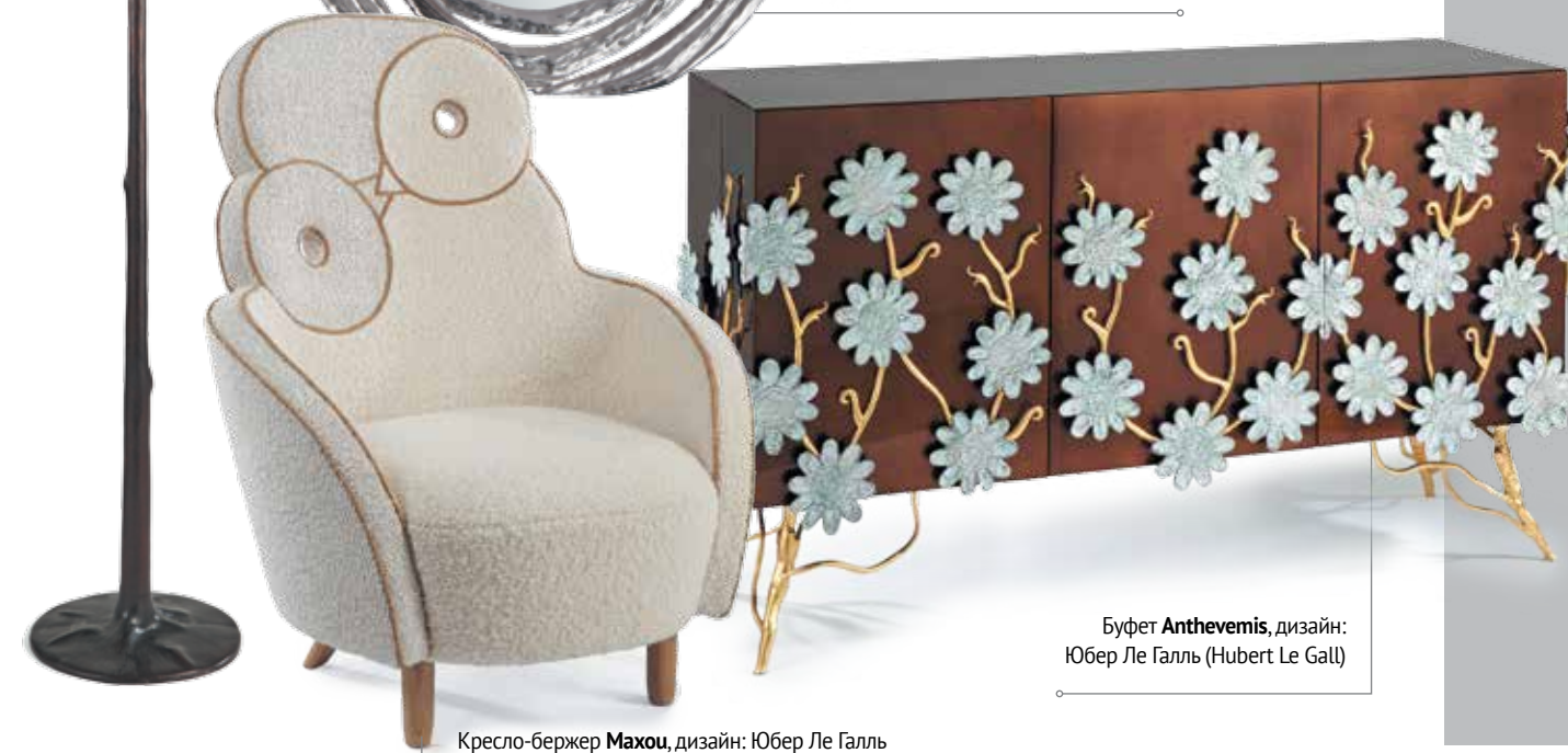
Кресло-бержер Махуи , дизайн: Юбер Ле Галль