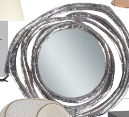
Зеркало Rondo , дизайн: Франк Эванну. Лимитированная серия из 25 экз.