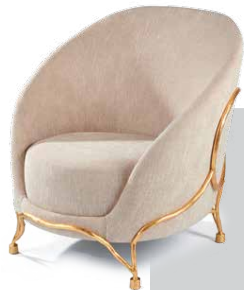
Кресло Berenice , дизайн: Элизабет Гаруст (Elizabeth Garouste). Лимитированная серия из 8 экз.

ной пышностью. Впрочем, барокко было и остается источником вдохновения для всех: и основательницы Avant-Scene, и художников. Объекты, представленные в галерее, существуют либо в единственном экземпляре, либо производятся ограниченным тиражом: в серии может быть от 8 до 25 авторских копий. Элизабет Делакарт не только управляет галереей, но и занимается оформлением интерьеров. В детстве Элизабет мечтала быть дирижером, а теперь оркестрирует проекты: как по нотам, подбирает каждому дому свою неповторимую композицию.