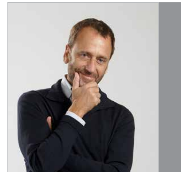
ДИЗАЙНЕР ЮБЕР ЛЕ ГАЛЛЬ

Юмор и оптические иллюзии – характерные черты стиля Юбера Ле Галля, «скульптора эмоций»