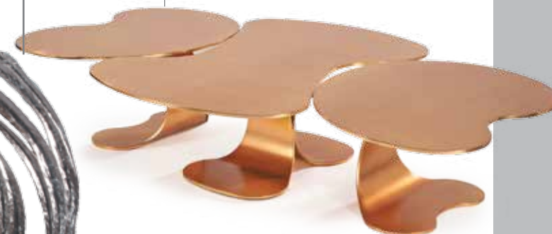
Стол Cyclades , дизайн: Юбер Ле Галль