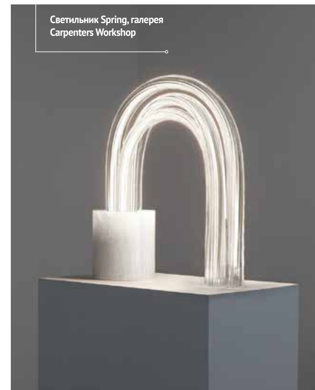
Светильник Spring, галерея Carpenters Workshop

Я бы хотел открыть свою школу: не только спроектировать здание и интерьер, но и разработать систему обучения для детей