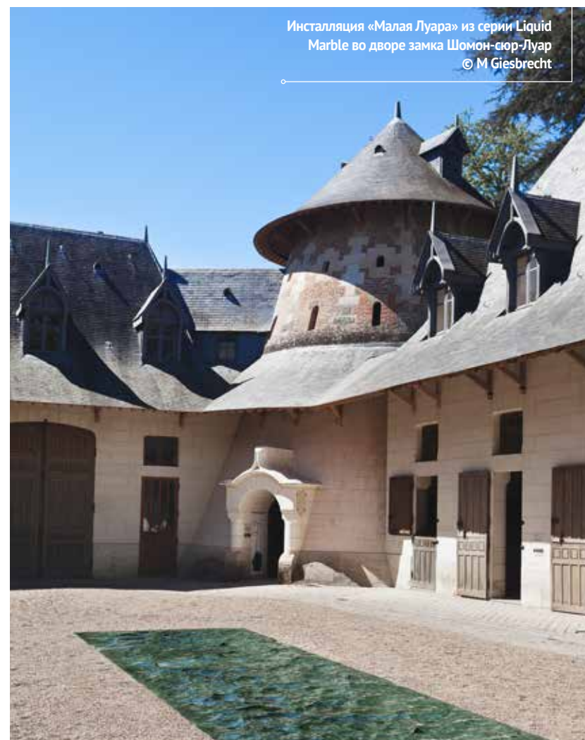
Инсталляция «Малая Луара» из серии Liquid Marble во дворе замка Шомон-сюр-Луар

Материалы для дизайнера как слова для писателя: инструменты, которые помогают выразить идею