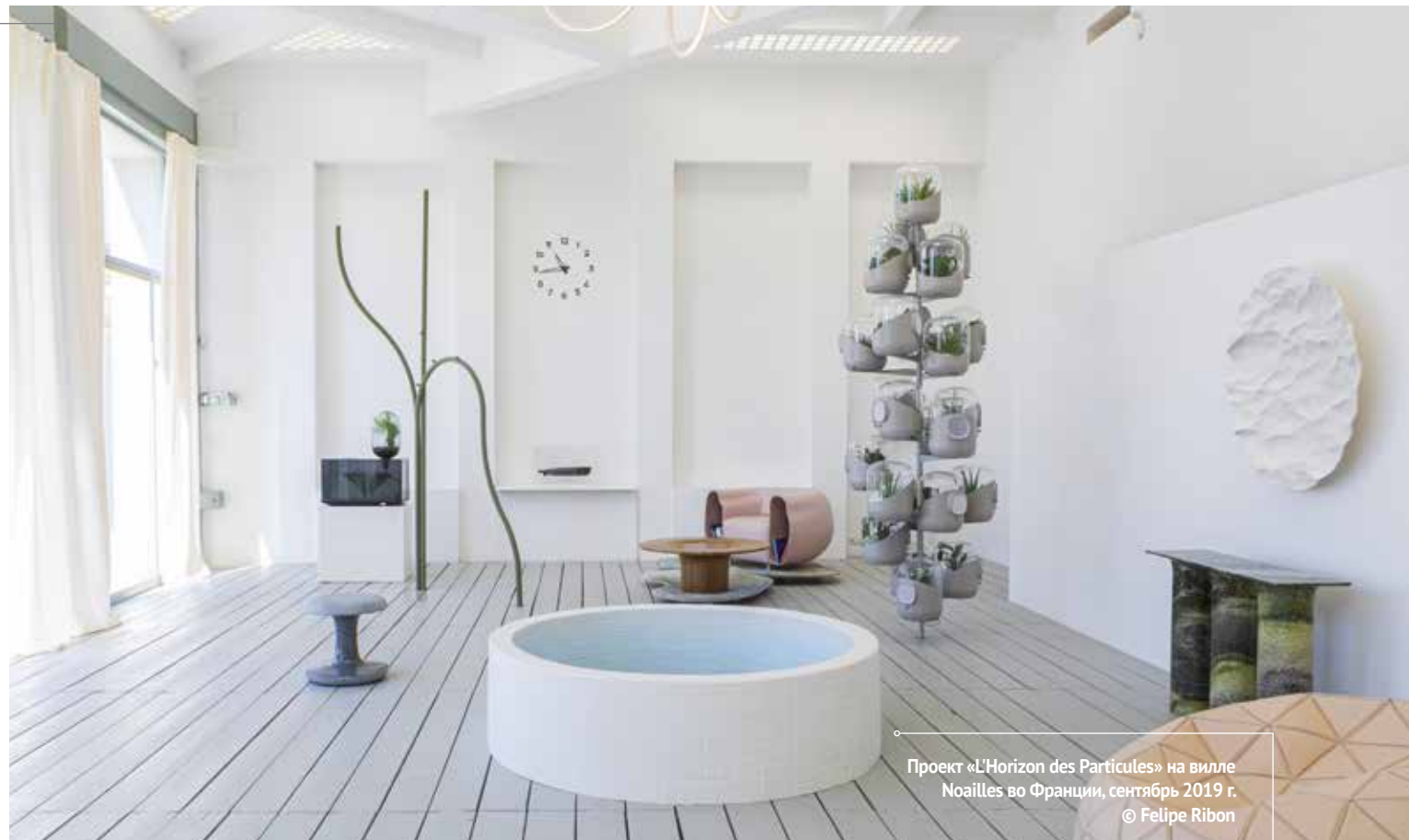
Проект «L'Horizon des Particules» на вилле Noailles во Франции, сентябрь 2019 г.