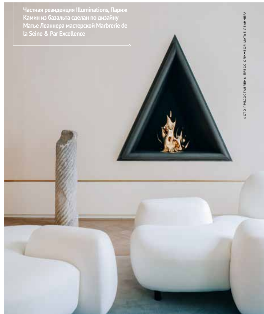
Частная резиденция Illuminations, Париж. Камин из базальта сделан по дизайну Матье Леаннера мастерской Marbrerie de la Seine & Par Excellence

Да. Я хочу, чтобы был соблюден баланс между визуальной стимуляцией и игрой их собственного воображения. Стимуляция вредит воображению, которое нуждается в тишине – и порой включается как раз тогда, когда человек мается от скуки.