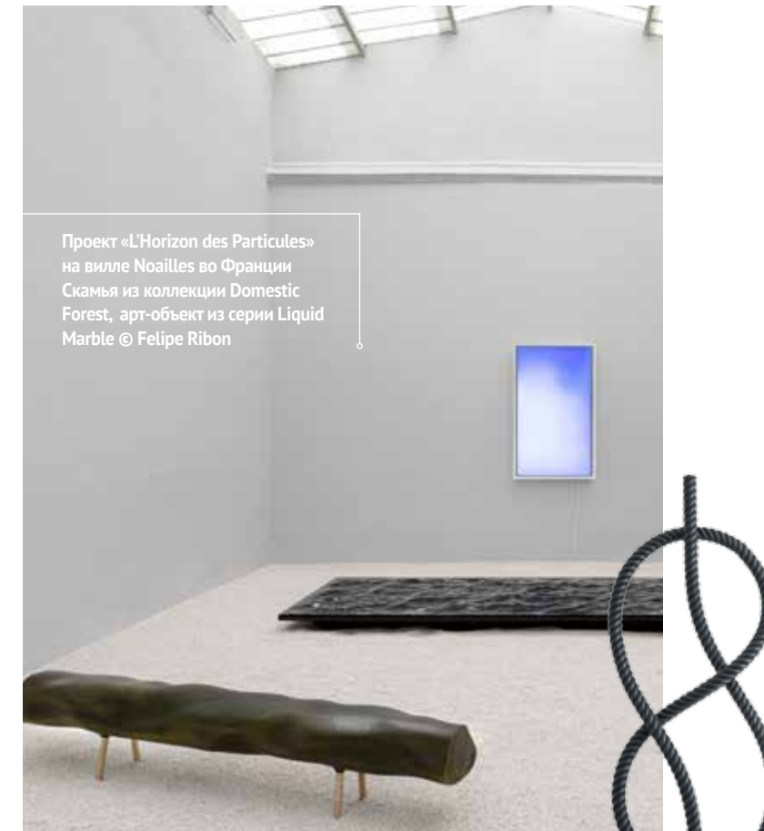
Проект «L'Horizon des Particules» на вилле Noailles во Франции. Скамья из коллекции Domestic Forest, арт-объект из серии Liquid Marble