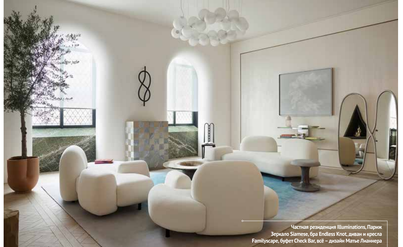
Частная резиденция Illuminations, Париж Зеркало Siamese, бра Endless Knot, диван и кресла Familyscape, буфет Check Bar, всё – дизайн Матье Леаннера